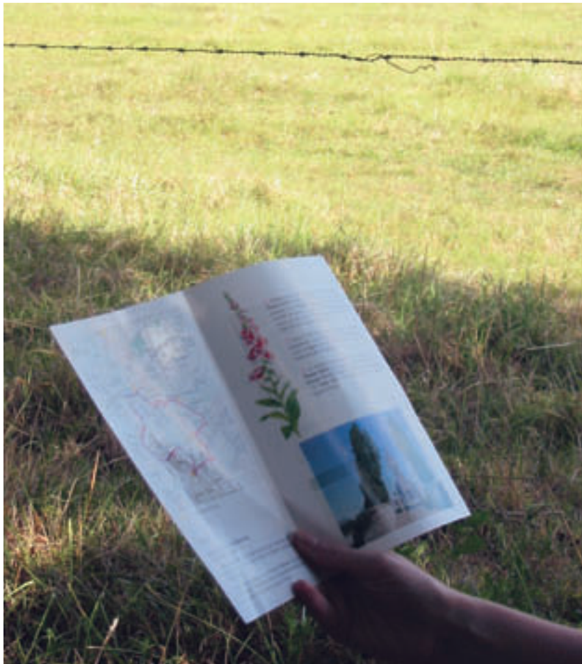
Les livrets d'information sont des outils intéressants pour orienter la fréquentation dans les espaces protégés. En attendant la généralisation des guides numériques...

des opportunités de valorisation des produits touristiques des professionnels partenaires, tout en tenant compte de la nécessaire protection de la ressource environnementale.