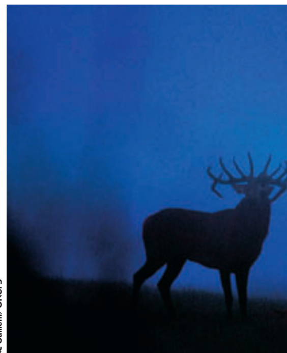
A. Guillem / ONCFS