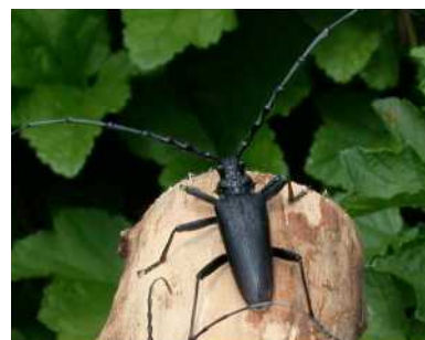
J. Armand / Proserpine

Le Grand Capricorne est l'un des plus grands cérambycides de France (les adultes mesurent de 24 à 55 mm). Le corps de forme allongée est de couleur noire brillante avec l'extrémité des élytres brun-rouge. Les antennes dépassent de trois ou quatre articles l'extrémité de l'abdomen chez le mâle. Chez la femelle, elles atteignent au plus l'extrémité de l'abdomen. Sa taille le distingue d'autres espèces de Cerambyx également présentes dans la région.