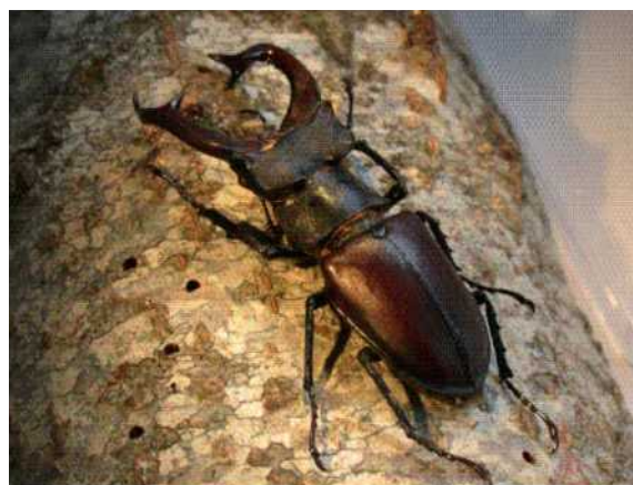
J. Armand / Proserpine

Il existe trois stades larvaires et sa taille peut atteindre 100 mm pour 20-30 g au maximum de sa croissance.