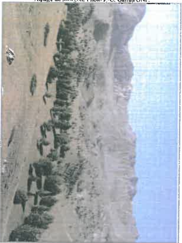
Alpage de Morgon.

A l'est du Cirque, le paysage est fortement marqué par l'impressionnant cône d'érosion de Bragousse, vaste zone de roches entièrement mises à nu par les phénomènes érosifs.