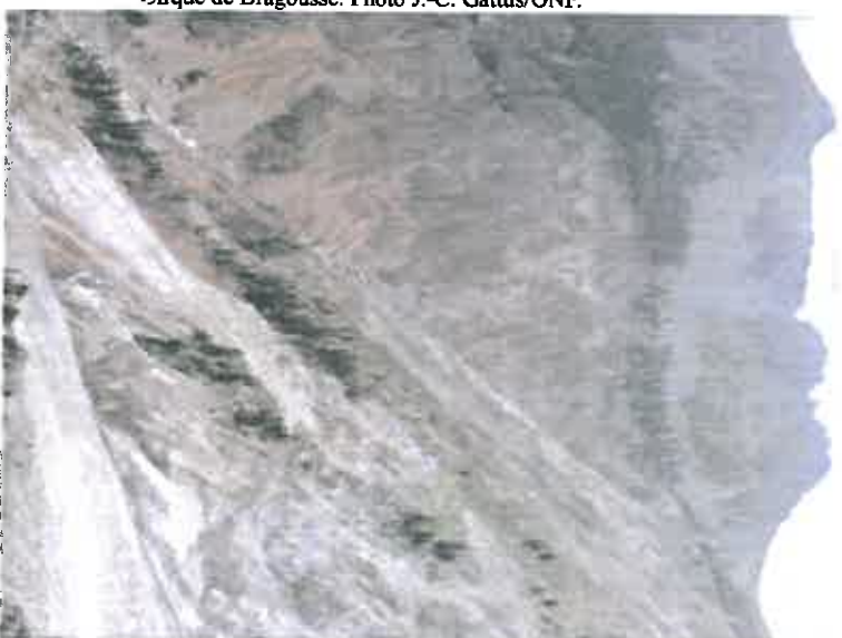
Cirque de Bragousse.

Sur le site aucun patrimoine bâti important n'est présent. Le réseau de pistes forestières est peu perceptible en vision extérieure. L'impression globale est celle d'un espace naturel préservé.