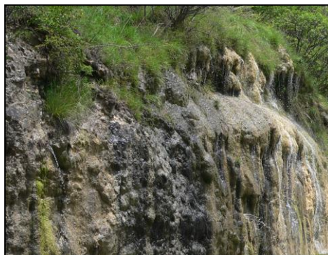
Source pétrifiante ou tuf

Les Gorges de la Méouge hébergent des espèces et des milieux naturels remarquables, rares ou vulnérables à l'échelle de l'Europe. Citons notamment le poisson « Barbeau méridional », le papillon « Damier de la Succise », la chauve-souris « Petit Rhinolophe ». La présence de ces espèces dans les Gorges de la Méouge témoigne de la qualité de ses milieux naturels.